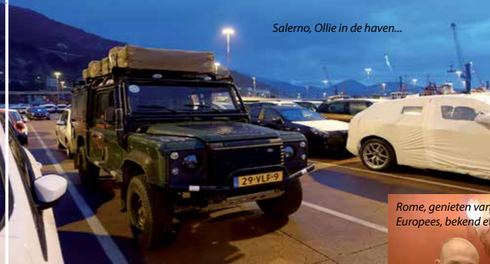
Salerno, Ollie in de haven...

Onze 20 jaar oude Land Rover gaat met een 'roll-on roll-off' ferry naar Italië. De verhalen die we op internet hebben gelezen over deze schepen, zijn niet echt rooskleurig: alles wat kan worden gejat, wordt ook gejat! Omdat de cabine uit veiligheidsoverwegingen open moet blijven, leggen we alles dat we hebben in de laadruimte: daar moet je namelijk minimaal twee sloten openbreken om naar binnen te komen. Zelfs de krik halen we onder de auto vandaan en de reserveband op de achterdeur zetten we vast met een hangslot. Een kapotte thermosfles, flessen water en een krukje laten we in de cabine achter als test. En inderdaad, die zijn natuurlijk weg. Maar dat ze zelfs hebben geprobeerd om de ingebouwde autoradio eruit te slopen, dat hadden we dan weer niet zien aankomen!