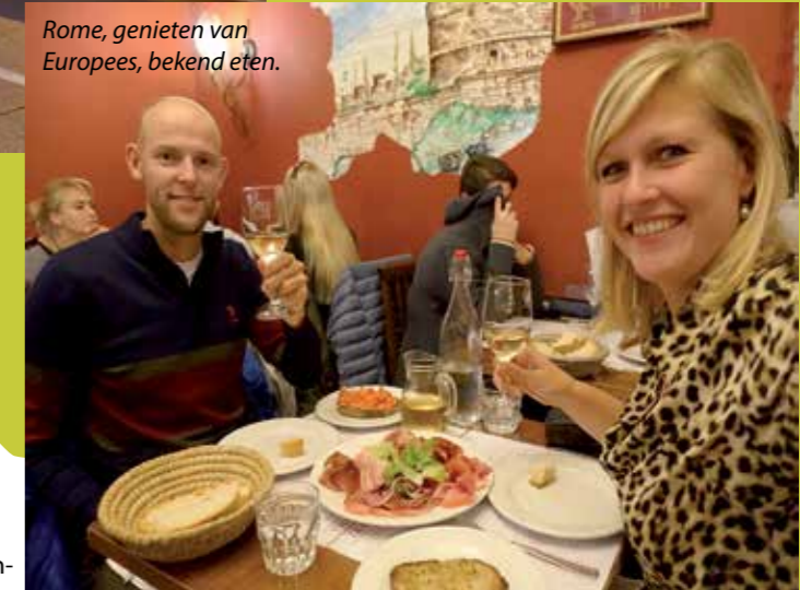
Rome, genieten van Europees, bekend eten.