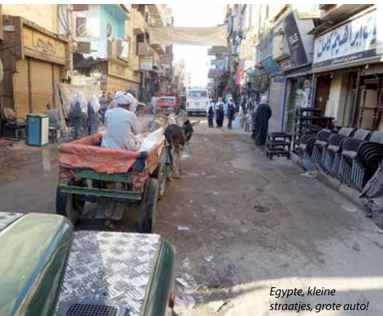
Egypte, kleine straatjes, grote auto!

planning. Voor onze keuze is het weer in Europa ook een belangrijk punt: kamperen in kou en regen lijkt ons niet echt een succes, dus we willen niet te lang in Europa hoeven te rijden. We hebben offertes opgevraagd voor het verschepen van Ollie naar Italië en Griekenland en Turkije. Uiteindelijk kiezen we ervoor om Ollie van Alexandrië naar Salerno in Italië te verschepen, zodat we 'nog maar' 1.800 kilometer naar Nederland hoeven te rijden. Dingen regelen in Egypte is ingewikkeld, omdat de meeste Egyptenaren geen Engels spreken. En aangezien ons Arabisch zich beperkt tot het lezen van getallen, mensen begroeten en vragen, hoe het gaat, besluiten we een partij in te schakelen, die voor ons de verscheping organiseert. Het bedrijf CFS regelt alles voor ons om de auto het land uit te krijgen, totdat de boot uit de haven vertrekt. De dag dat we bij het kantoor aankomen om de papieren op orde te maken, verloopt exact zoals alles in Afrika: zonder al te veel communicatie en zeer chaotisch!