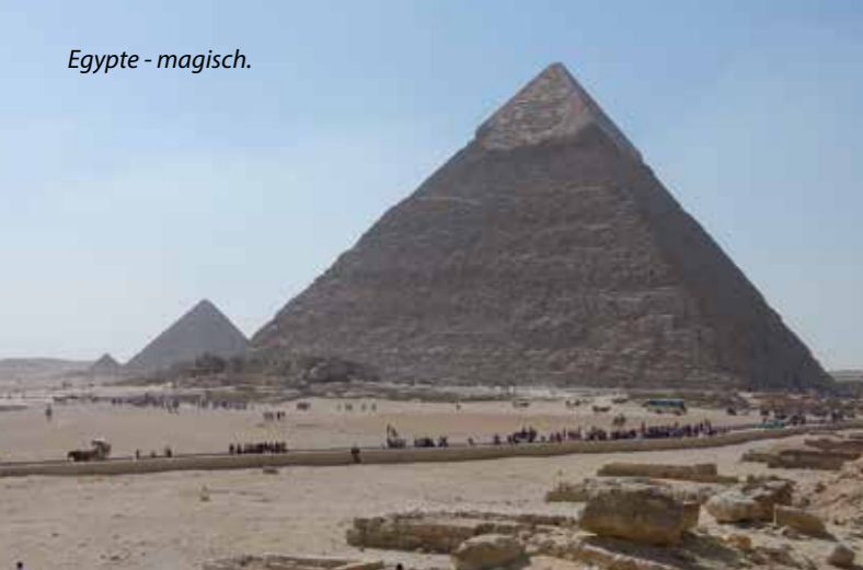
Egypte - magisch.

planning. Voor onze keuze is het weer in Europa ook een belangrijk punt: kamperen in kou en regen lijkt ons niet echt een succes, dus we willen niet te lang in Europa hoeven te rijden. We hebben offertes opgevraagd voor het verschepen van Ollie naar Italië en Griekenland en Turkije. Uiteindelijk kiezen we ervoor om Ollie van Alexandrië naar Salerno in Italië te verschepen, zodat we 'nog maar' 1.800 kilometer naar Nederland hoeven te rijden. Dingen regelen in Egypte is ingewikkeld, omdat de meeste Egyptenaren geen Engels spreken. En aangezien ons Arabisch zich beperkt tot het lezen van getallen, mensen begroeten en vragen, hoe het gaat, besluiten we een partij in te schakelen, die voor ons de verscheping organiseert. Het bedrijf CFS regelt alles voor ons om de auto het land uit te krijgen, totdat de boot uit de haven vertrekt. De dag dat we bij het kantoor aankomen om de papieren op orde te maken, verloopt exact zoals alles in Afrika: zonder al te veel communicatie en zeer chaotisch!